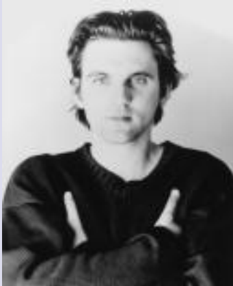
Sebastian Schipper, Regisseur