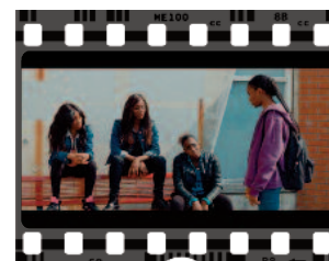
Marieme rejoint le groupe des filles