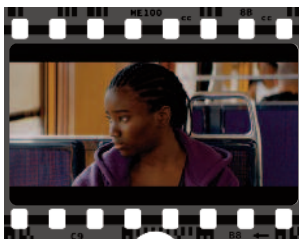
Marieme va à l'école